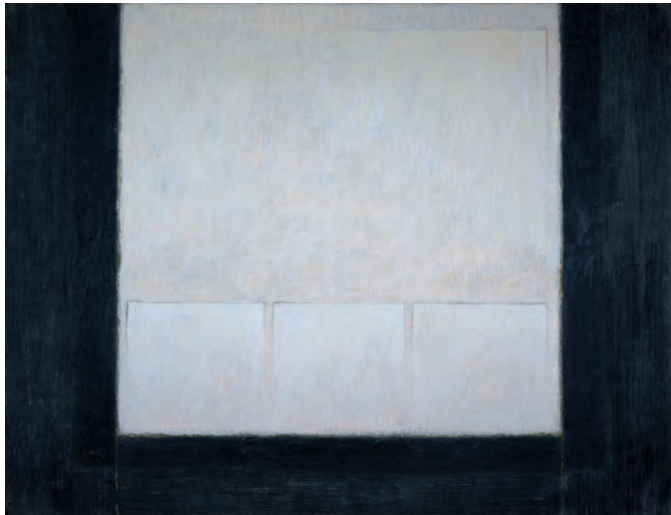
Kunstpries der Künstler

»das onomato« Video- und Klangkunstarbeiten aus dem Umfeld der Künstlergruppe.